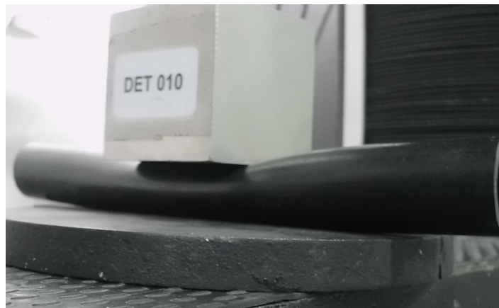
Detalhe: Corpo de prova durante ensaio