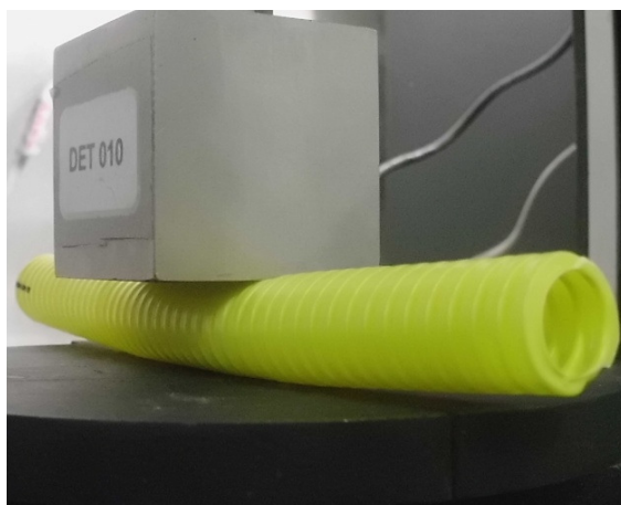
Detalhe: Corpo de prova durante ensaio de resistência à compressão