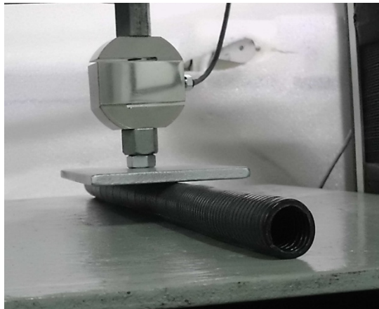
Detalhe: Corpo de prova durante ensaio