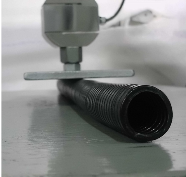
Detalhe: Corpo de prova durante ensaio