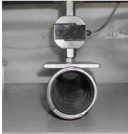
Detalhe: Corpo de prova durante ensaio